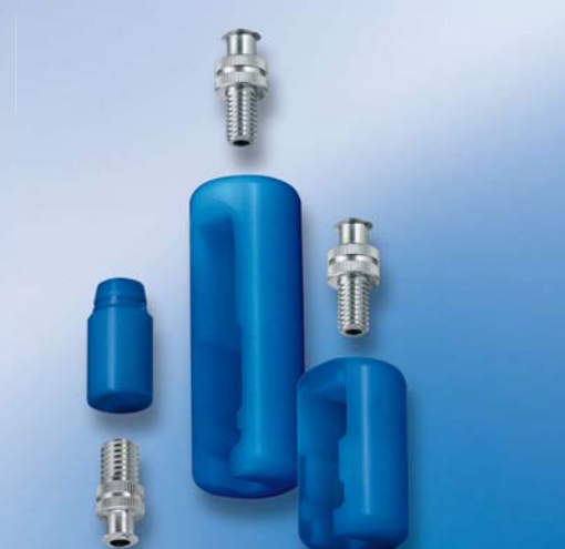
GENIUS - 使循环使用更便捷！